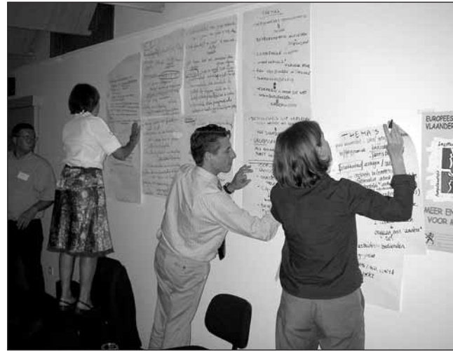
Het maken van een murkrant.

volgende stap meer uitleg geeft en (2) een detailverslaggever (iemand van de werkgoesting-ploeg) om later de detailverslaggeving te vergemakkelijken.