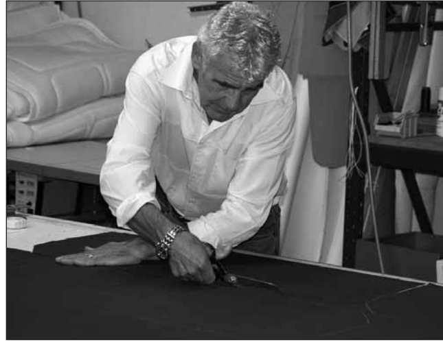
en de meester aan de slag.