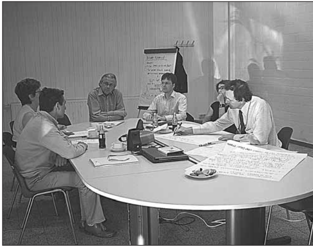
Werken in kleine groep.